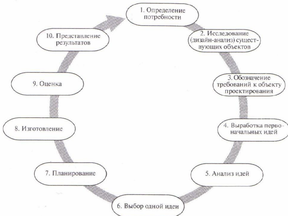
Схема организации проекта М.Б. Романовской 1 (дизайн-петля)